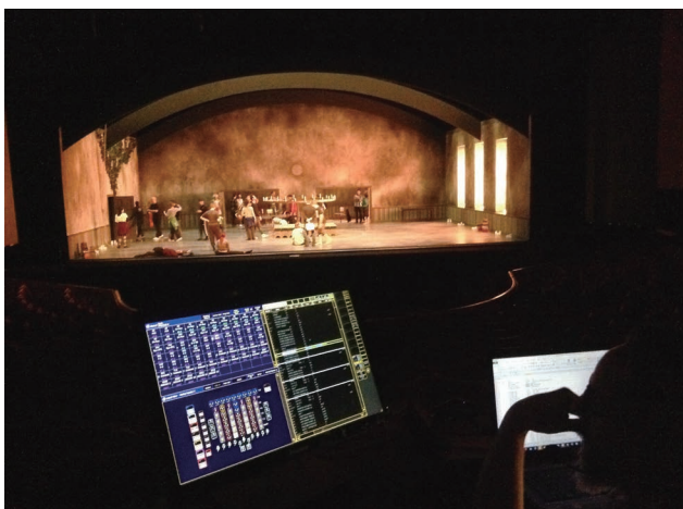
1幕目の舞台と窓からのソフトライト(色を抜く前)

次の日の朝、ほとんどのパーカンから色を抜き、窓のフロストはそのまま、1幕すべての光量の再調整とMovingのリフォーカスを2~3時間でされました。ガイ氏と、劇場プログラマーの間には、互いに気の効かせ合いとおもひやり、よい信頼関係が築かれていたお陰で、再調整はスムーズに、的確に行われ、午後のテクニカルリハーサルには、なんとか間に合いました。とりあえず1幕は、ほっと一息。来月号も引き続き、ガイ氏のシャドウレポートを書かせていただきたいと思います。